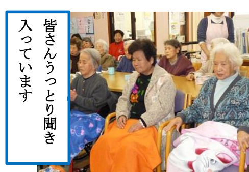
皆さんうっとり聞き入っています