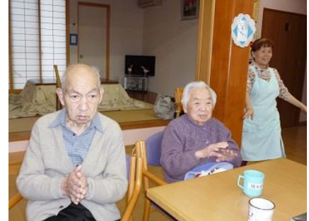
今年も一年ありがとうございました。