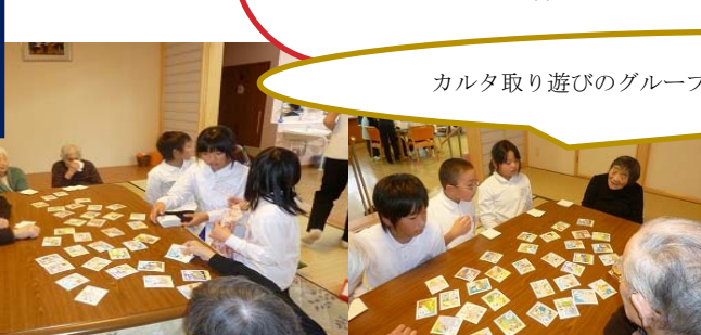
カルタ取り遊びのグループです。さあ〜読むよ！ 真剣そのもの