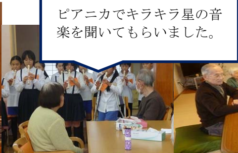
ピアノでキラキラ星の音楽を聞いてもらいました。